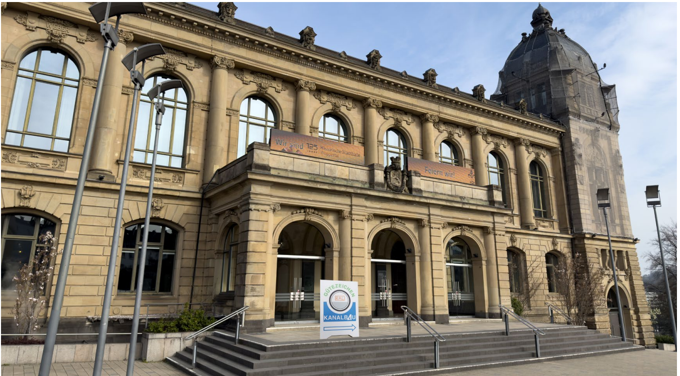
In der historischen Stadthalle in Wuppertal fand die diesjährige Mitgliederversammlung der Gütegemeinschaft Kanalbau statt.